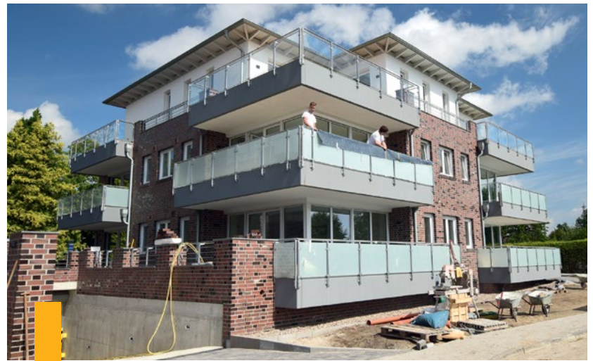
Wohnanlage In der Baumschule 8 & 10, Westerstede

In bester Innenstadtlage der Kreisstadt Westerstede ist in den vergangenen Monaten wohl eine der schönsten Wohnanlagen Westerstedes erbaut worden.